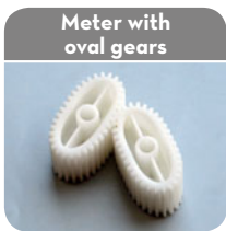
Meter with oval gears