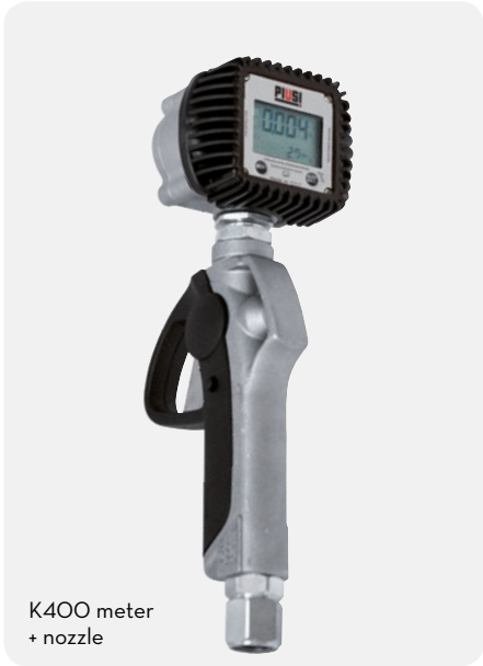
K400 meter + nozzle