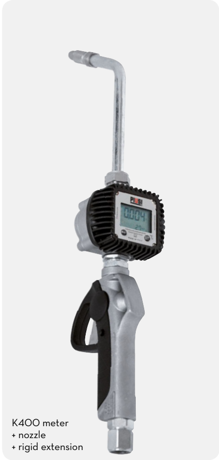
K400 meter + nozzle + rigid extension