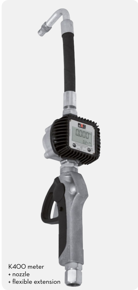
K400 meter + nozzle + flexible extension